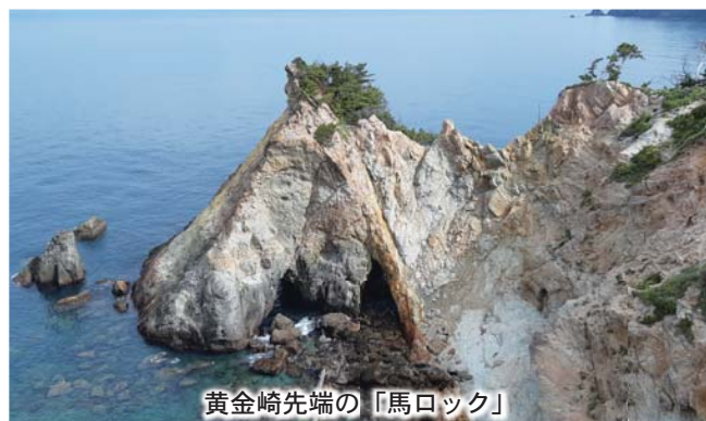
黄金崎先端の「馬ロック」

黄金崎の「馬ロック」は昔、馬にはあまり似ていませんでした。長年にわたり風雨や波で浸食され、崩落などがあり、いつの間にか「馬に似てない？」と多くの声を聞くようになったのです。 そこで2014年(午年)9月16日(競馬の日)に商工会青年部が中心となり、町や観光協会の協力を得て愛称を「馬ロック」と命名しました。この名は全国公募をし、500以上の候補から選考委員の投票により決定したものです。 青年部員による、ゆるキャラ「馬ロックくん」とパフォーマンス集団「馬ロックん's」が活躍したり、パンフレットやHPに掲載してもらったりして、今では人気のフォトスポットになっています。