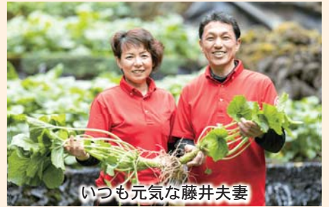
いつも元気な藤井夫妻