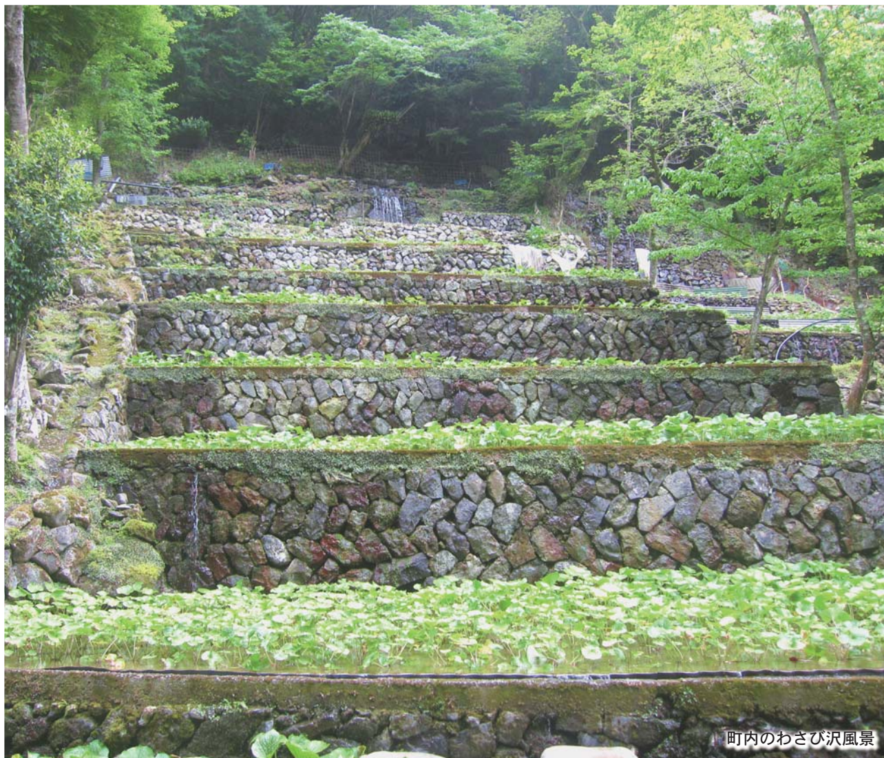
町内のわさび沢風景